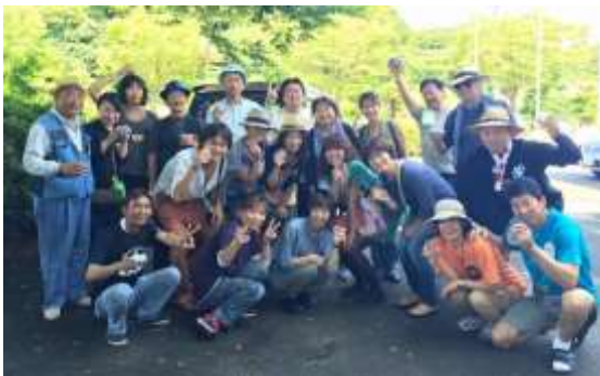
2日目の交流会の様子

また、今後の取り組みとして、インターネットを使った空き家マップの活用など、離れていても島の方々やとりしながら出来る活動も提案。行政からの参加もあり「受け入れ体制が整っていたからこそこうした継続があったのでは」と評価されました。