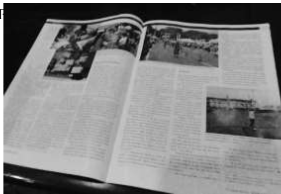
The Japan Journal 2014年11月号